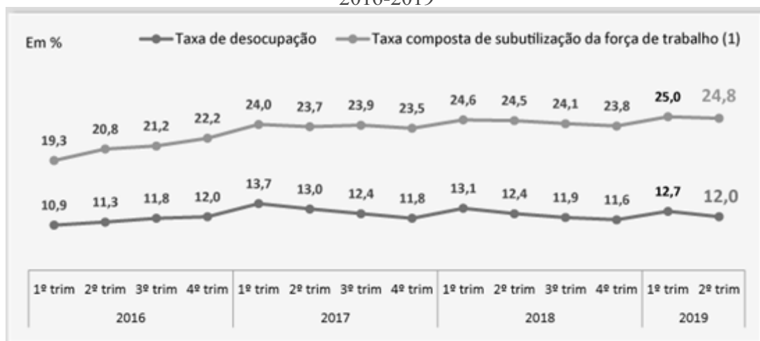
Taxa de desocupação e taxa composta de subutilização da força de trabalho Brasil – 2016-2019

(1) Pessoas desocupadas + subocupadas por insuficiência de horas trabalhadas + força de trabalho potencial, dividida pela soma da força de trabalho e da força de trabalho potencial.