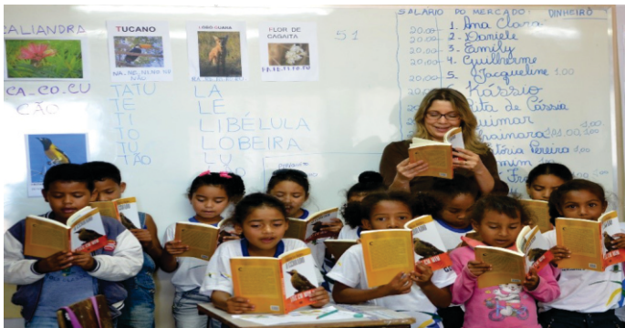
Por Mariana Tokarnia, Agência Brasil, Brasília, em 06/04/17 <acesso em 26/02/2019.

A imagem a seguir retrata uma sala de aula, na qual a professora e as crianças estão participando de um evento de letramento (SOARES, 2003, 2004).