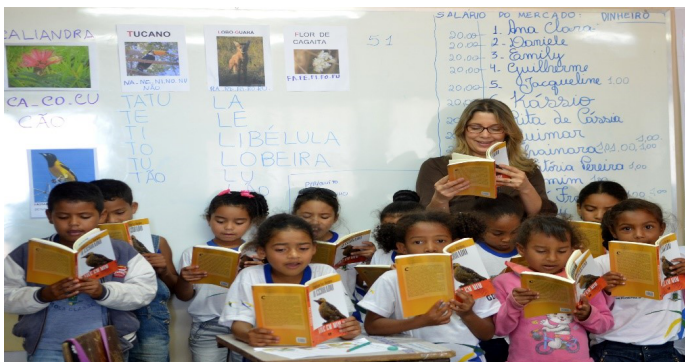
Por Mariana Tokarnia, Agência Brasil, Brasília, em 06/04/17 <acesso em 26/02/2019.

A imagem a seguir retrata uma sala de aula, na qual a professora e as crianças estão participando de um evento de letramento (SOARES, 2003, 2004).