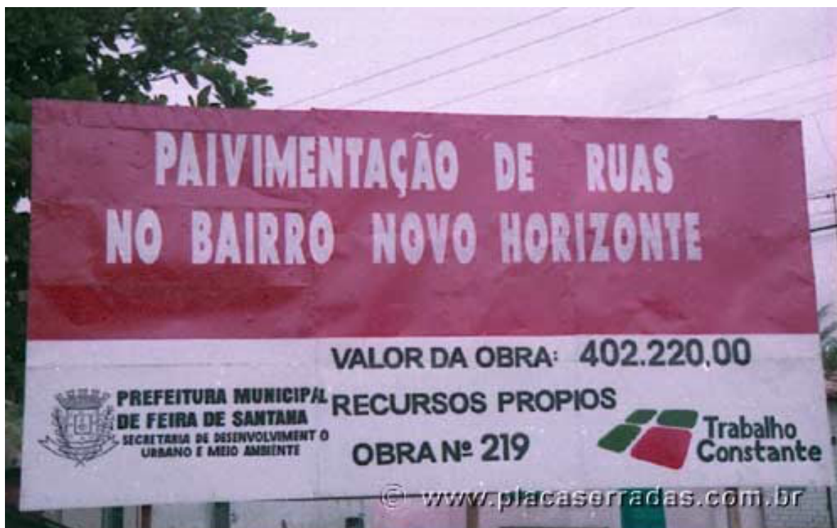
Rodovia Salvador-Tanquinho, Bahia, próximo à UEFs, junho 2002

Atente à cena abaixo para responder as questões de 16 a 18.