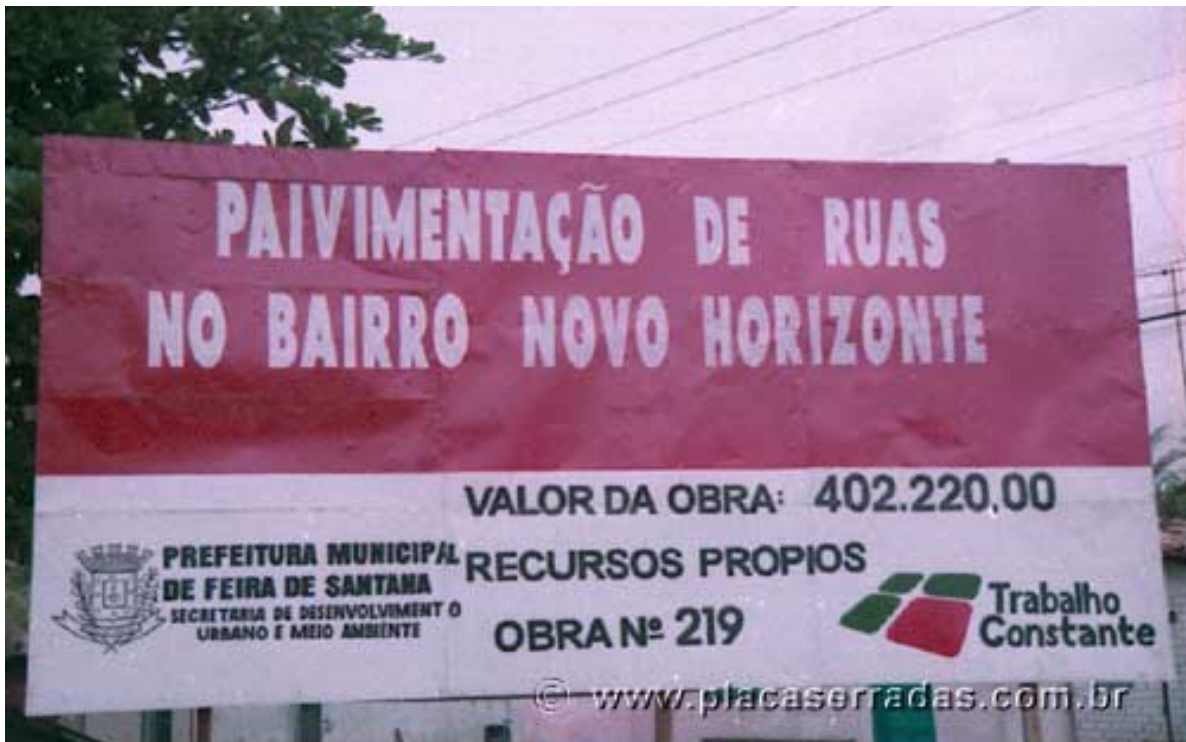
Rodovia Salvador-Tanquinho, Bahia, próximo à UEFs, junho 2002

Atente à cena abaixo para responder as questões de 16 a 18.