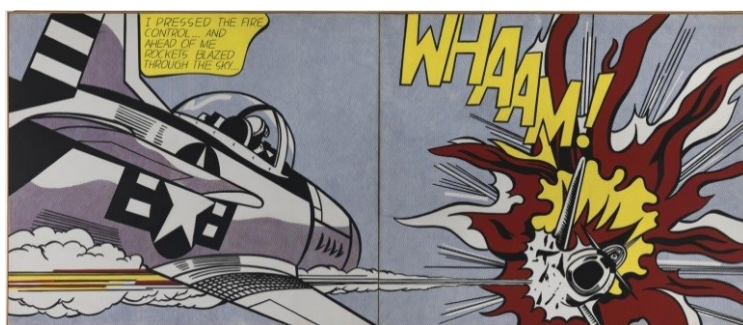
Whaam! , Roy Lichtenstein, 1963

As obras dos artistas desse movimento são chamadas de: