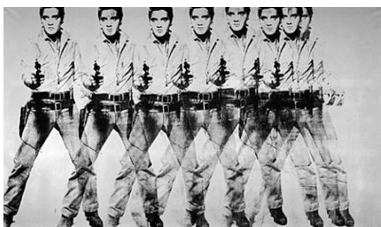
Eight Elvises , Andy Warhol, 1963

A palavra “arte” adquire diferentes conceitos em cada época e, por vezes, um novo significado surge pelo impacto causado por um movimento artístico contagiante. Nos anos 60 do século XX, surge um movimento que se fundamenta em ideias antiarte , e foi promotor de “(...) uma grave cisão entre o que se chama de arte 'aplicada' ou 'comercial', que nos cerca em nosso dia a dia, e a arte 'pura' das exposições e galerias, que tantos de nós têm dificuldade para compreender” (Gombrich, 2013, p. 474).