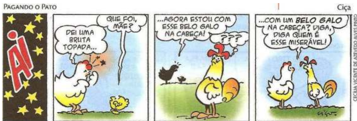
▲ CIAÇA. Pagando o pato. Porto Alegre: L&PM, 2006. p. 12.

Leia a tirinha abaixo e analise-a com relação à ambiguidade: