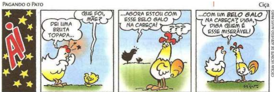
▲ CIÇA. Pagando o pato. Porto Alegre: L&PM, 2006. p. 12.

Leia a tirinha abaixo e analise-a com relação à ambiguidade: