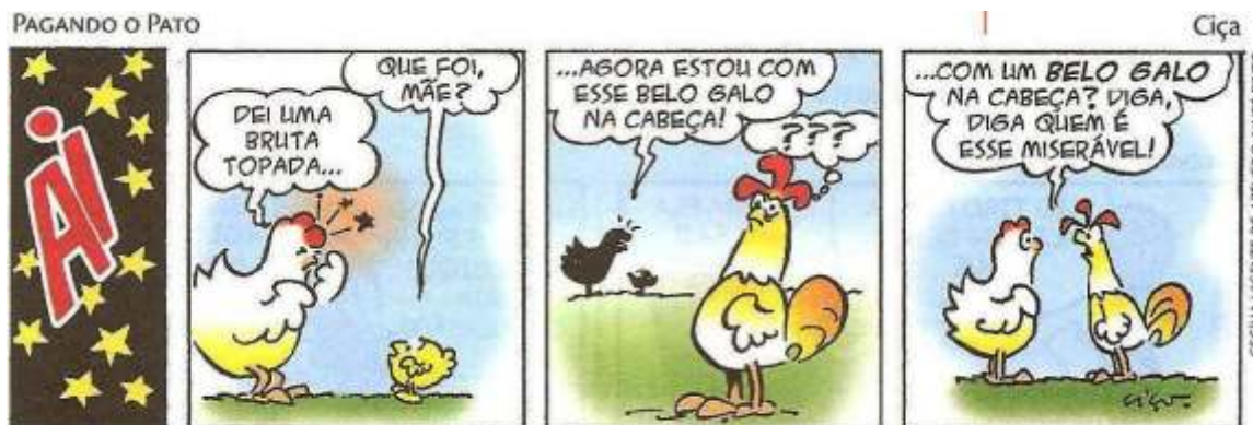
▲ CIÇA. Pagando o pato. Porto Alegre: L&PM, 2006. p. 12.

Leia a tirinha abaixo e analise-a com relação à ambiguidade: