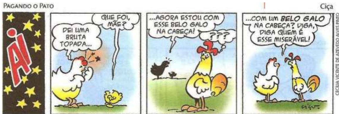
▲ CIAÇA. Pagando o pato. Porto Alegre: L&PM, 2006. p. 12.

Leia a tirinha abaixo e analise-a com relação à ambiguidade: