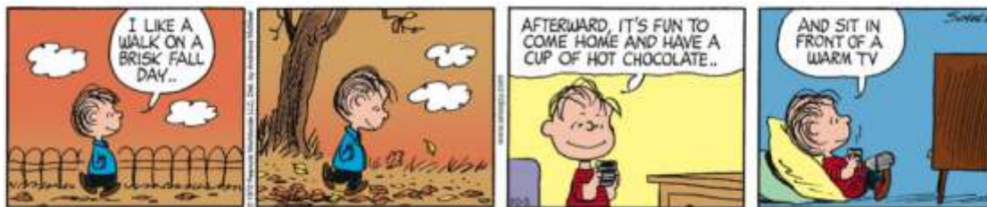
Available at http://www.gocomics.com/peanuts . Accessed on October 5 th , 2017.

In the following comic stripe, the word “Afterward” can be substituted without change in meaning for