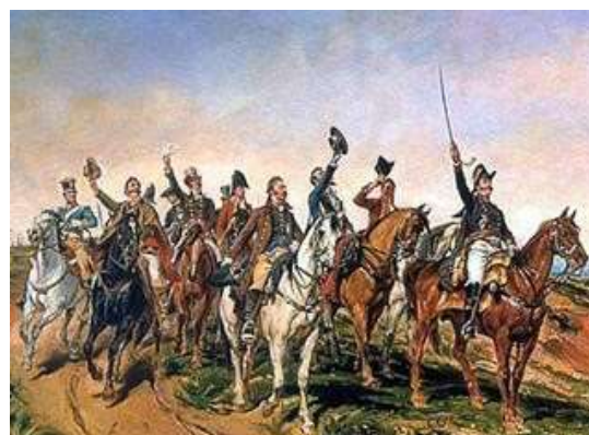
Imagem 4: Independência ou Morte.

Observe as imagens acima e associe as duas colunas relacionando cada uma delas às respectivas autorias das pinturas e/ou descrição dos artistas e do que documentaram.