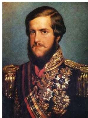
Imagem 2: Dom Pedro II O Imperador.