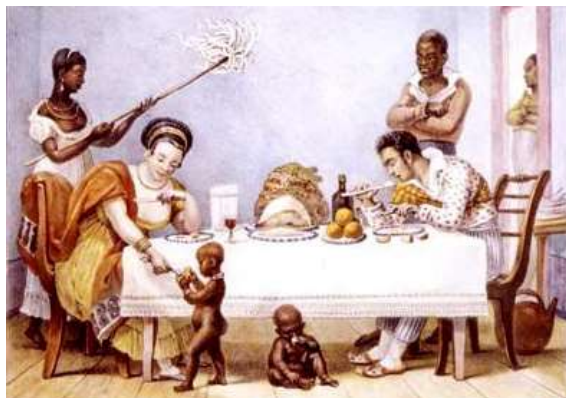
Imagem 1: Um jantar brasileiro, 1827.