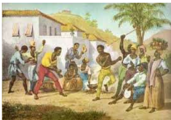
Imagem 3: Roda de Capoeira.