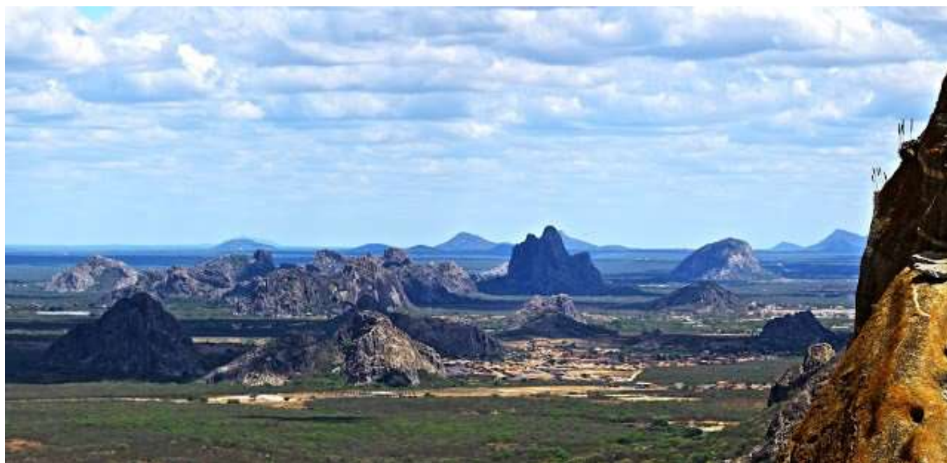
Visão panorâmica dos monólitos de Quixadá.

“O Monumento Natural Os Monólitos de Quixadá, unidade de conservação de proteção integral, criada por meio do DECRETO Nº 26.805, de 25 de outubro de 2002, abrange uma área delimitada pelas seguintes coordenadas geográficas: Latitude Sul entre 04° 54' e 05° 02' e Longitude Oeste entre 38° 53' e 39° 06'. Localiza-se no Município de Quixadá, a aproximadamente, 158 Km de Fortaleza.” ( http://www.semace.ce.gov.br/2010/12/1639/ acesso em 09/05/2018).