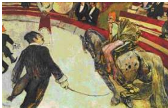
“No Circo Fernando: a Amazona”, 1888.