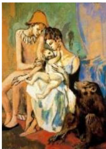
“Família de Acrobatas com um Macaco”, 1905.