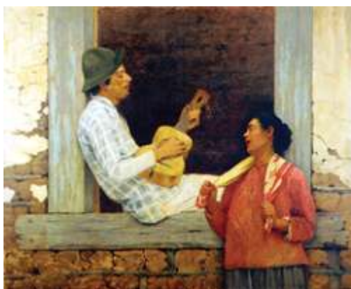
Almeida Júnior, (...), óleo sobre tela, 147 x 172 cm, 1899.

As novas propostas metodológicas para as aulas de Arte citam a releitura da imagem como uma das atividades criadoras mais recomendadas, ressaltando-se que nela: (...) “há transformação, interpretação, criação com base num referencial, num texto visual que pode estar explícito ou implícito na obra final.” (Analice Dutra Pillar, 2003, p. 18). Observe as obras abaixo e assinale a opção CORRETA.