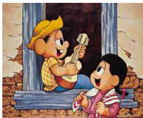
Maurício de Souza, (...), acrílica sobre tela, 121 x 151,5 cm, 1995.