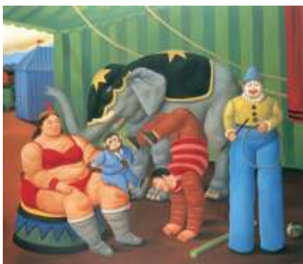
“Família de Circo com Elefante”, 2007.