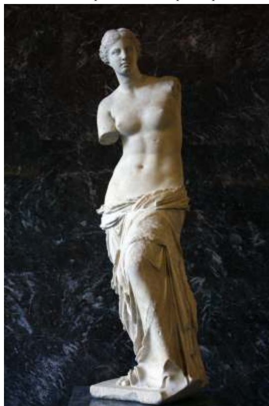
Vênus de Milo, c 200 a. C.

Sobre a escultura abaixo podemos dizer que faz parte da: