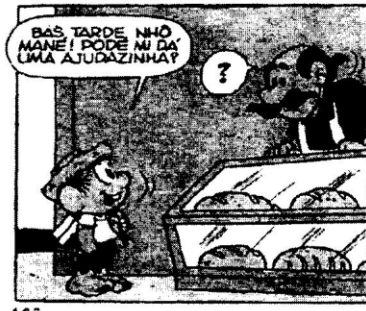
Revista Chico Bento: Escola. São Paulo: Editora Globo, nº 24.