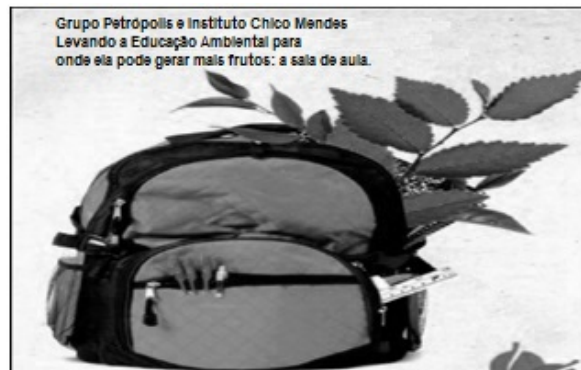
(Revista ISTOÉ, de 27 de julho de 2011, p. 85 / com adaptações)