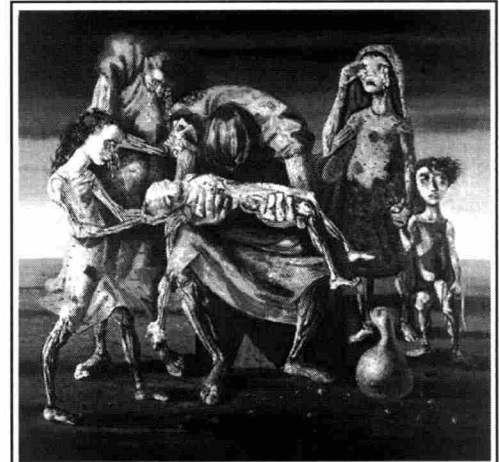
CANDIDO PORTINARI, Criança Morta, 1944 Óleo s/ tela, 176 x 190 cm. Col. Museu de Arte de São Paulo Assis Chateaubriand São Paulo, Brasil