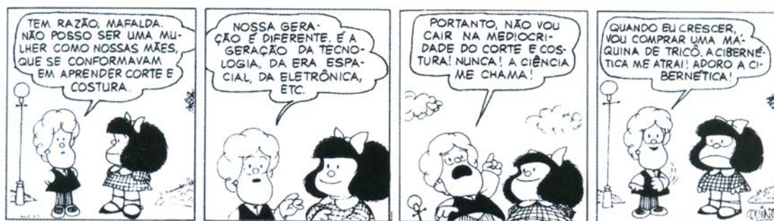
Quino. Mafalda , nº 3. São Paulo: Martins Fontes, 1990. p. 40.

Leia os Quadrinhos: Responda às questões de 18 a 20