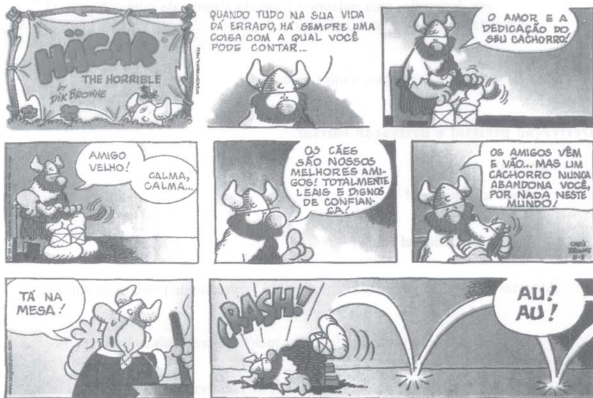
Dik Browne. 'Hagar'. Folha de S. Paulo, Ilustrada, 30/8/1999.