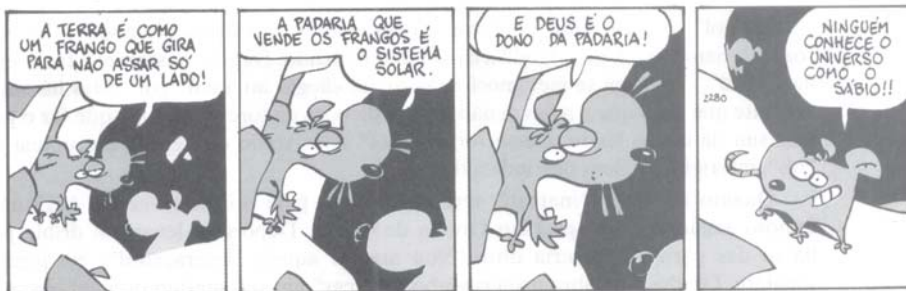
Fernando Gonsales. 'Níquel Náusea'. Folha de S. Paulo, Ilustrada, 7/12/1993.

Analise as proposições e marque a alternativa adequada. Está(ão) correta(s)